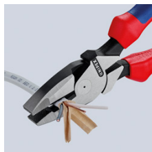
Продольное резание для разделения плоских кабелей