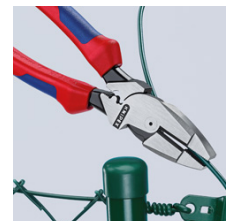
Область захвата с крестообразной насечкой для крепкого зажима и вытягивания при сооружении оград