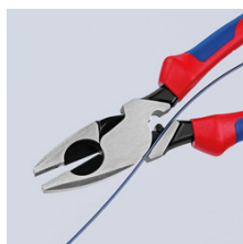
09 11/12 240: приспособление для втягивания кабеля в прорези шарнира